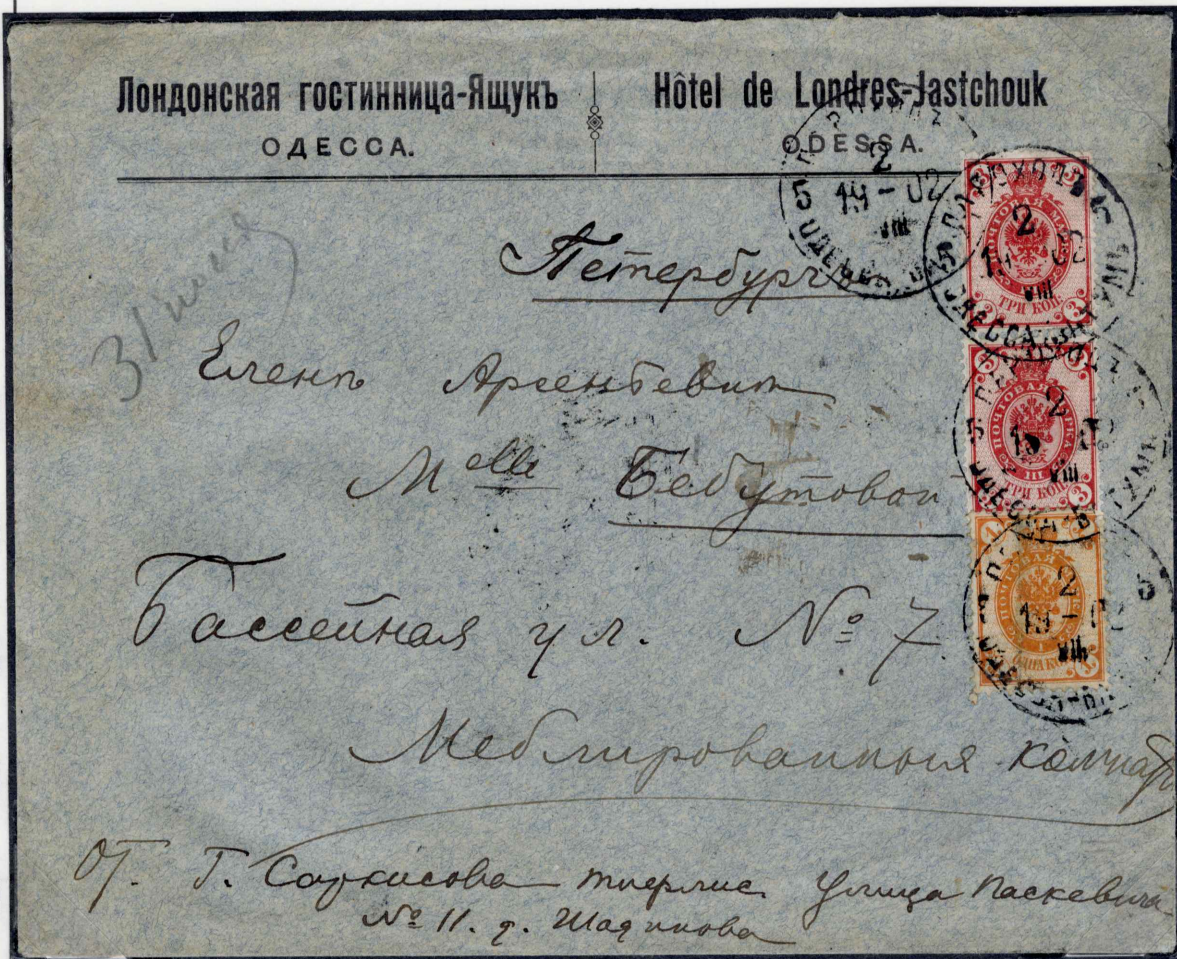
Cover sent from Odessa to St.-Petersburg. Cancellation and dispatch single-ring "crossed date" postmark of the Odessa-Batum steamship post office, serial "5" (2.08.1902) and arrival double-ring postmark (on the reverse) of the St.-Petersburg Pochtamt (6.08.1902).