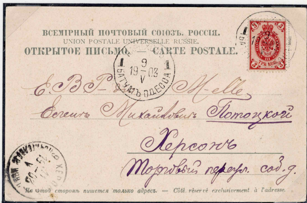
Postcard sent to Kherson. Cancellation and dispatch single-ring "crossed date" postmark of the Batum-Odessa steamship post office, serial "1" (9.05.1903) and arrival single-ring postmark of the Kherson post and telegraph office (11.05.1902).